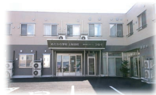
めだかの学校上桜田校/有料老人ホームつなぐ